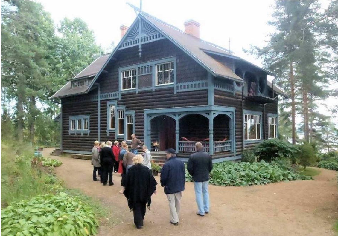
Kantrin vuoden 2010 hankkeen Vihreä Sydän - Green Hearth –yrittäjiä tutustumassa Pölkkylään.

ilmoittautumisten vuoksi, ja Pirkkalassa kyläkoordinaattori vieraili kylien ja omakotiyhdistysten yhteistyötoimikunnan omassa tilaisuudessa. Kylien yhteistyötä avustettiin myös hajakentämisen hallinnan suunnittelua seuraavassa kylien työryhmässä. Kylätalo-opas valmistui syyskuussa ja sitä on esitelty eri tilaisuuksissa, myös Hämeenlinnassa Pitäjärinki-hankkeen järjestämässä Seurantalo-illassa. Hankkeen omaan tiedotukseen perustettiin blogi sekä Facebook-sivu. Syksyllä postitettiin tiedote kylille, lisäksi hankkeen asioista on tiedotettu KantriNewsissä.